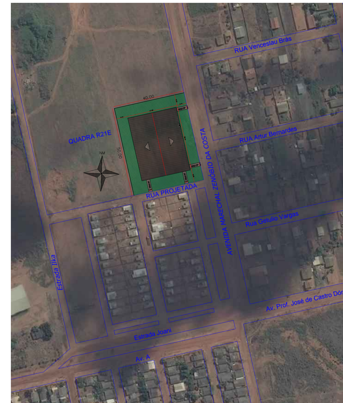
03 Planta de Localização Esc.: 1/1000